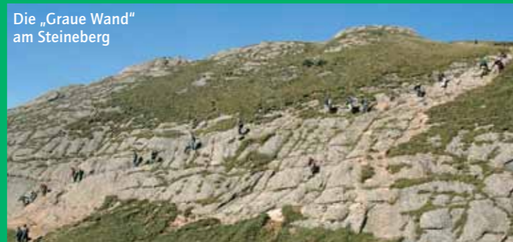
Die „Graue Wand“ am Steineberg