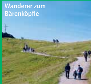
Wanderer zum Bärenköpfe